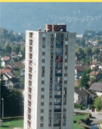
Aix-les-Bains. Tour Misaine