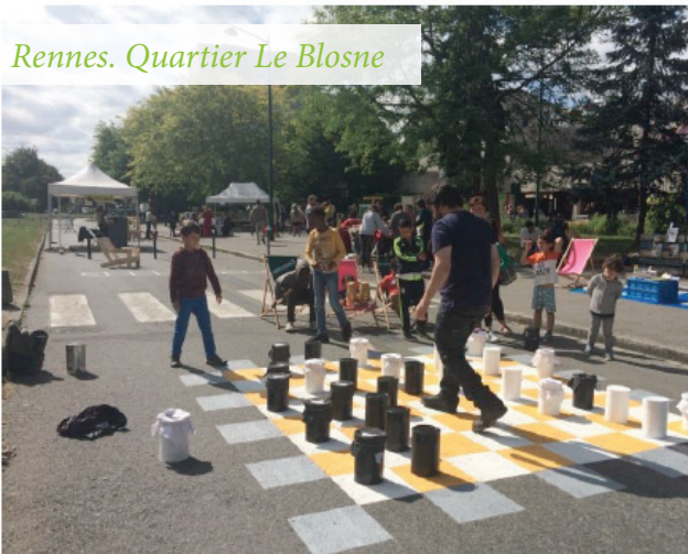
Art'dep Plastique Sociale & Création Permanente